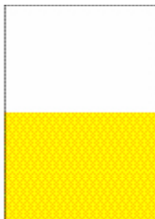
1/2 page horizontale (188 x 134 mm)