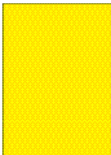
1/1 page (216 x 308 mm, coupure 3 mm incluse, ou 188 x 271 mm)