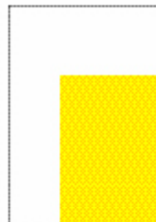
Juniorpage (134 x 188 mm + coupure 3 mm)