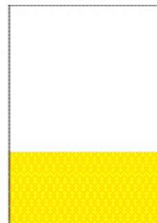
1/4 page verticale (188 x 88 mm)