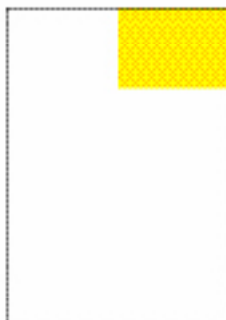
1/4 page horizontale (92 x 65 mm)