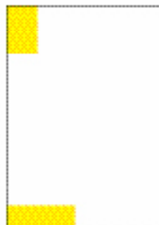
1/4 page verticale (en haut) (44 x 65 mm) 1/4 page horizontale (en bas) (92 x 30 mm)