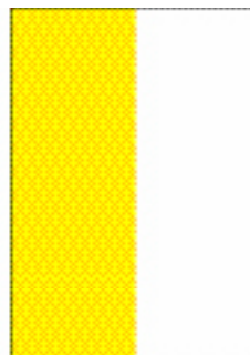
1/2 page verticale (92 x 271 mm)